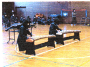
各部実演して活動を紹介