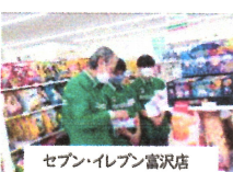
セブン・イレブン富沢店

他にも、夢の森幼稚園、ほうりゅうじ保育園、みらく食堂、えそうしカフェ、余市図書館、観光協会でも職業体験をさせていただきました。二日間、業務多忙の中、温かくきめ細かなご対応をいただき、本当にありがとうございました。ご都合がございましたら発表会へ是非お越しください。