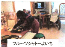
フルーツシャトーよいち