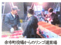
余市町役場からのリンゴ選果場