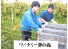
ワイナリー夢の森