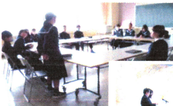
初!後期代表委員会

12日の認証式、27日の生徒総会を経て、生徒会活動は完全に2年生へバトンタッチされます。西中の伝統を継承しながらも新しい西中生徒会を作っていくください。