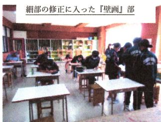
細部の修正に入った「壁画」部

今年度は「よさこい演舞」「劇」「壁画」の3つの中から1人1つ選択し、縦割り班で3年生を中心に活動を始めました。また、合唱は学年ごとに歌唱します。