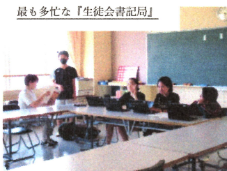
最も多忙な「生徒会書記局」