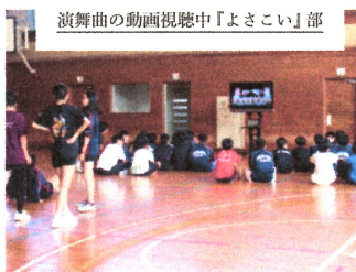
演舞曲の動画視聴中「よさこい」部