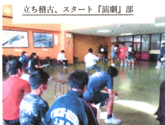
立ち稽古、スタート「演劇」部