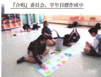
「合唱」委員会、学年目標作成中