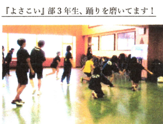
「よさこい」部3年生、踊りを磨いています！