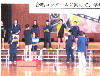
合唱コンクールに向けて、学年ごとの練習が始まりました！