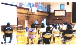
保護者の皆さんの参加もありました。

6月20日(火)、余市警察署から講師を招き、2年生を対象に「薬物乱用防止教室」を実施しました。喫煙・飲酒の危険性、薬物の恐ろしさについてスライドや動画で学びました。更に、誘われたときの断り方を具体的に教えていただき、どうしても断れないときは、「逃げること」など、自分の今、そして未来を守るためにすべきことも学びました。